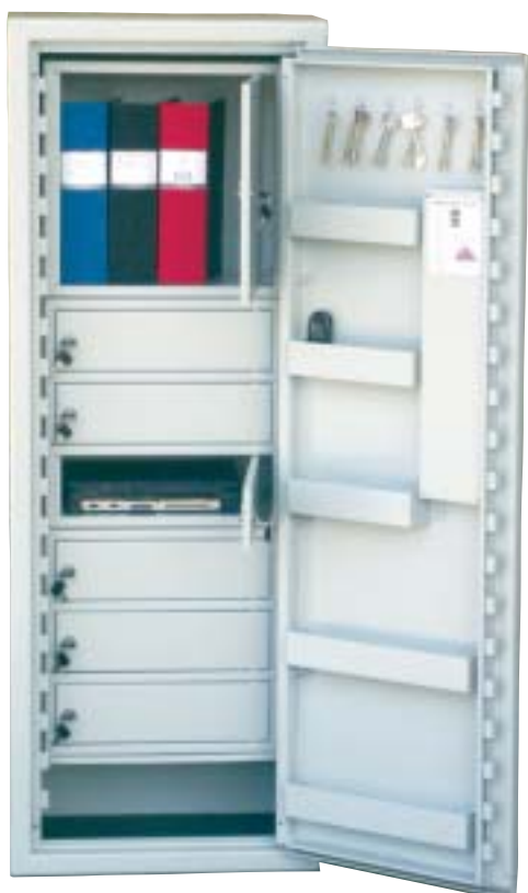
SP88 med låsbara fack

Många väljer att ha låsbara fack i säkerhetsskåpet. Då fungerar själva skåpet som ett skalskydd och de låsbara facken kan vara personliga fack.