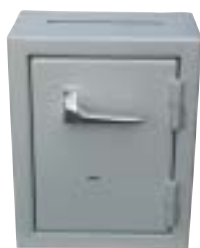
SP111 inkast i toppen

Dessa skåp är tillverkade enligt SS-3492 men eftersom hål görs gäller inte certifieringen om man använder skåpet separat. Levereras med högsäkerhetslås och kodlås går att få som tillbehör.