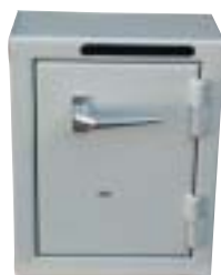
SP111 inkast ovan dörr