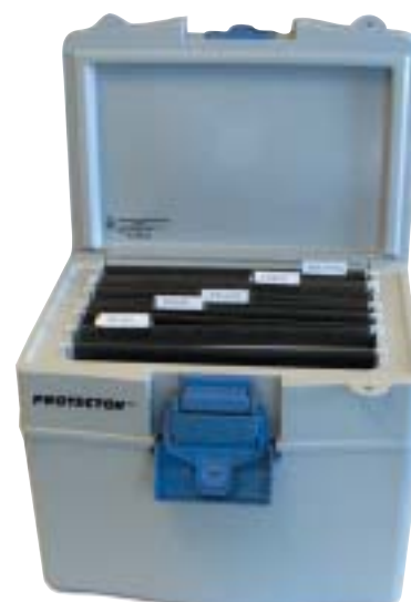
Brandboxar för olika ändamål.